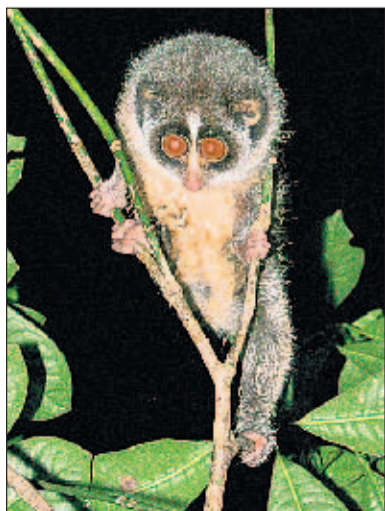
Seit 1937 nur viermal gesichtet: der Faulaffe.

Dafür mussten die Experten der Londoner Zoological Society mehr als 200 Stunden auf der Lauer liegen, wie die Forschungsgesellschaft berichtete. Der nachtaktive Primat mit besonders dichtem Fell wurde seit 1937 nur viermal gesichtet und galt zwischen 1939 und 2002 sogar als komplett verschwunden. (dpa, red)