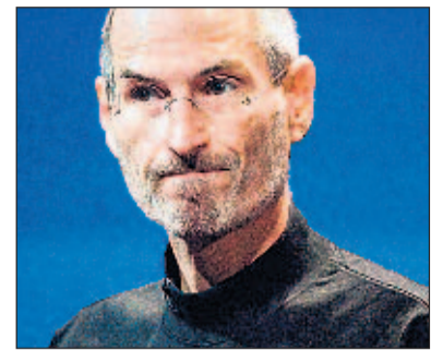
Niemand ist perfekt, nicht einmal Steve Jobs' iPhone 4.

Nokia unterstützte zwar Apples Behauptung, dass Antennen durch die Art des Haltens beeinträchtigt werden können. Darum würden die Finnen teilweise zwei Antennen in Handys einbauen.